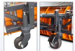
Laufrollen (Vollgummi oder Luftbereift)