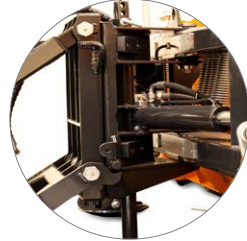
getrennte Hebe- & Schwenkeinrichtung