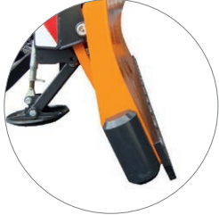
Aggressiver Anstellwinkel 25°