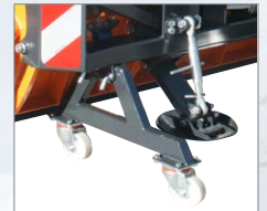
Abstellwagen zum einfachen Abstellen und Rangieren im abgehängenen Zustand